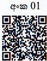
For Download Your Application